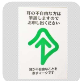
A4のポスター(210mm×297mm) 1枚 90円 A3のポスター(297mm×420mm) 1枚 100円