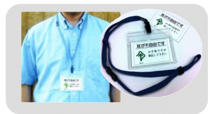
ネックホルダーのセット カードAまたはB 410円