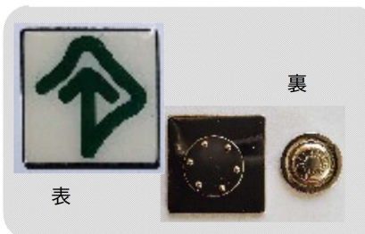
マグネット式バッジ (縦2.8cm×横2.8cm) 800円