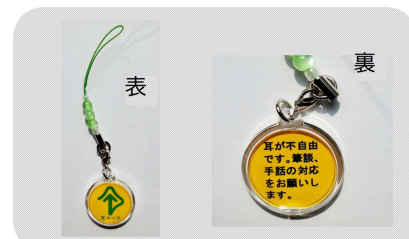
ストラップ(円形2.9cm) 410円