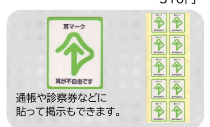
シール (1シート10枚、縦2.7cm×横2cm) 100円