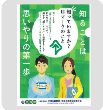
クリアファイル タイプA 「知ることは思いやり」 300円