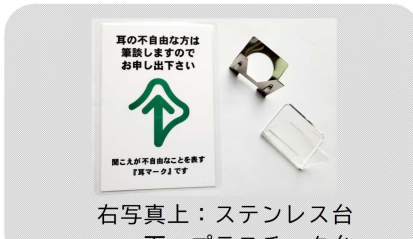
表示板用カード……200円 表示板用台……1個 110円