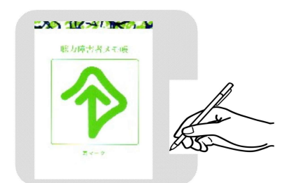
メモ帳(A6版100枚綴り) 200円