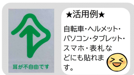
耐水性ステッカー(縦7cm×横5cm) 250円