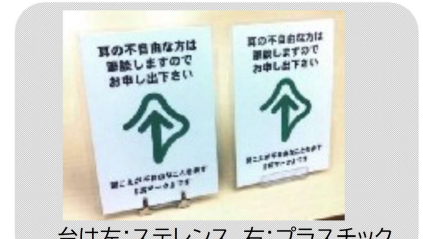
表示板セット(縦15.3cm×横11.1cm) 310円