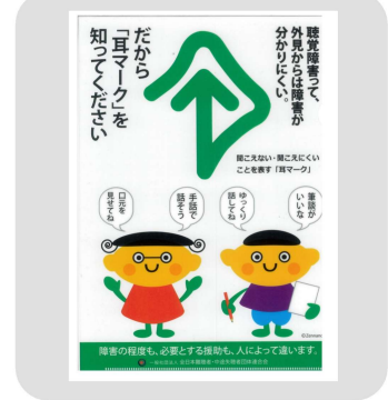
クリアファイル タイプC 「ミミコとミミオ」 300円