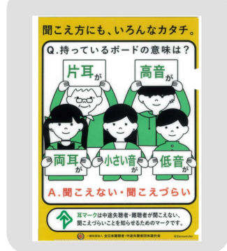
クリアファイル タイプB 300円 「聞こえ方にもいろんなカタチ」